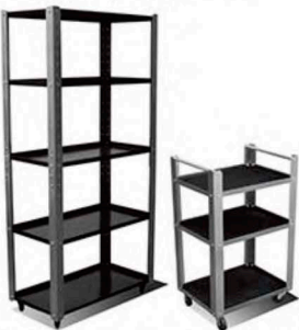
Medidas: 80 X 40 X 170h Clave: C0111 Medidas: 54 X 40 X 86h Clave: C0114