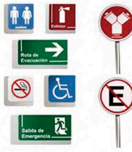
Medidas: 17 X 17h 25 X 25h 35 X 19h 30 X 40h Clave General: S011 Medidas: 49ø Clave General: S051