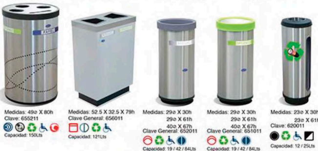
Medidas: 49ø X 80h Clave: 655211 Medidas: 52.5 X 32.5 X 79h Clave General: 656011 Medidas: 29ø X 30h 29ø X 61h 40ø X 67h Clave General: 652011 Medidas: 29ø X 30h 29ø X 61h 40ø X 67h Clave General: 651011 Medidas: 23ø X 30h 23ø X 61h Clave: 620011