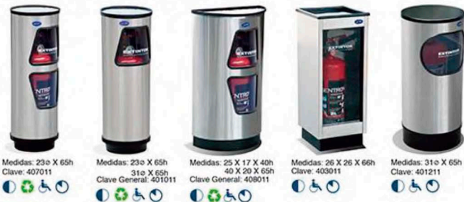
Medidas: 23ø X 65h Clave: 407011 Medidas: 23ø X 65h 31ø X 65h Clave General: 401011 Medidas: 25 X 17 X 40h 40 X 20 X 65h Clave General: 408011 Medidas: 26 X 26 X 65h Clave: 403011 Medidas: 31ø X 65h Clave: 401211