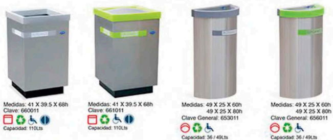
Medidas: 41 X 39.5 X 68h Clave: 660011 Medidas: 41 X 39.5 X 68h Clave: 661011 Medidas: 49 X 25 X 60h 49 X 25 X 80h Clave General: 653011 Medidas: 49 X 25 X 60h 49 X 25 X 80h Clave General: 656011