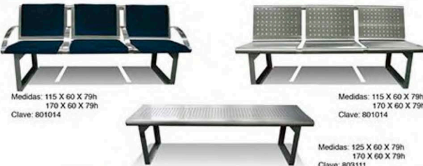
Medidas: 115 X 60 X 79h 170 X 60 X 79h Clave: 801014 Medidas: 115 X 60 X 79h 170 X 60 X 79h Clave: 801014 Medidas: 125 X 60 X 79h 170 X 60 X 79h Clave: 803111