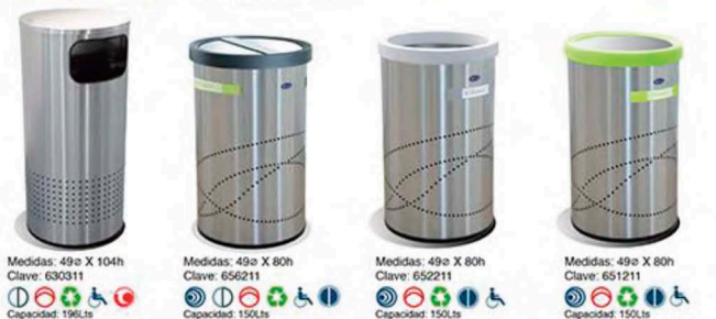
Medidas: 49ø X 104h Clave: 630311 Medidas: 49ø X 80h Clave: 656211 Medidas: 49ø X 80h Clave: 652211 Medidas: 49ø X 80h Clave: 651211